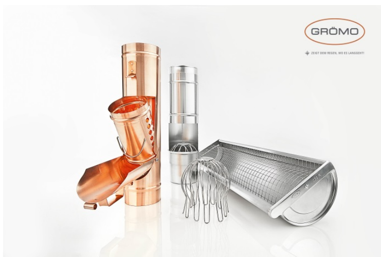
Bildtext: Die GRÖMO Laubschutzlösungen für Dachrinne und Fallrohr: Laubfänger mit Korb, Laubfalle mit Sieb, Rinnenseiher und Laubschutzgitter