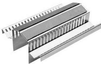
Bildtext: Das GRÖMO Lüfterfirstelement mit einem Lüftungsquerschnitt von 240 cm 2 /m.