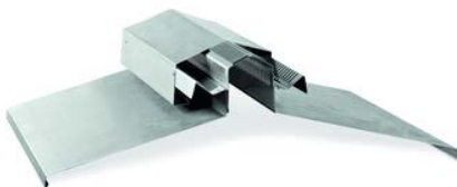
Bildtext: Der GRÖMO Lüfterfirst mit Anschluss ans Metaldach.