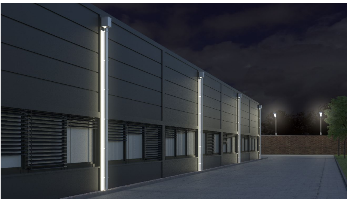
Bildtext: LED-Fallrohrbeleuchtung an einem Industriegebäude