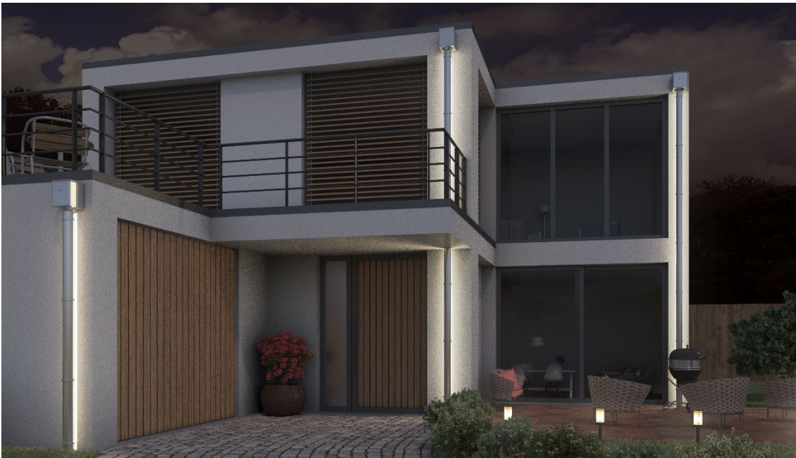
Bildtext: LED-Fallrohrbeleuchtung an einem Wohngebäude im Bauhausstil

Manuel Kitzinger GRÖMO GmbH & Co. KG Tel: +49 8342 912-535 Fax: +49 8342 912-493 Röntgenring 2, 87616 Marktoberdorf E-Mail: kitzinger@groemo.de