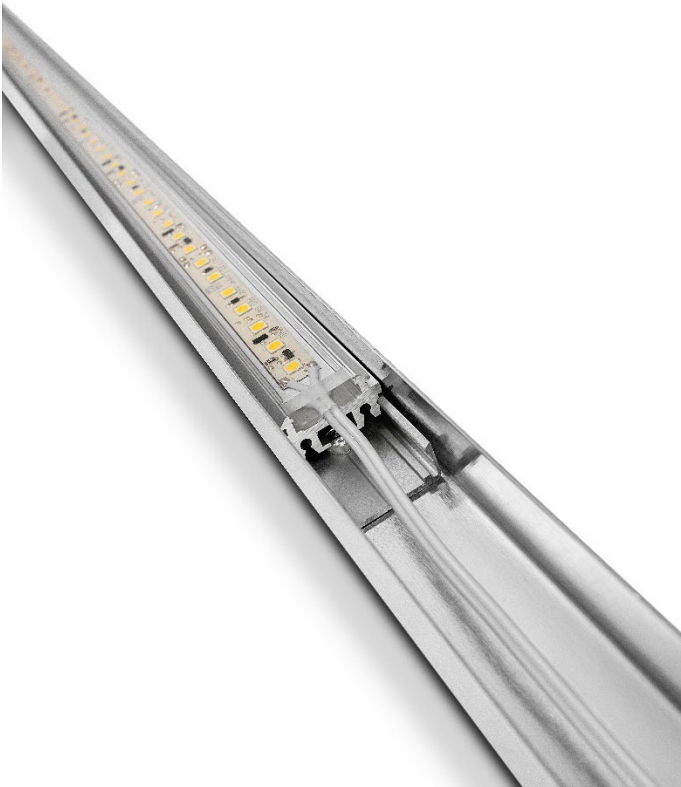
Bildtext: In der Sichtblende vernietete Montageclips fixieren die LED-Linearleuchte im Profil