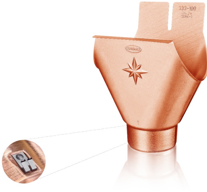
Bildtext: Der ovale GRÖMO Einhangstutzen mit neuer Klemmfeder